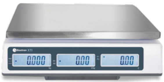
Tre baggrundsbelyst kunde display